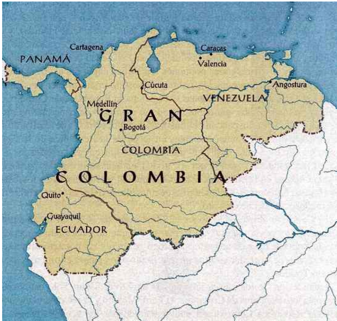
Mapa de la Gran Colombia